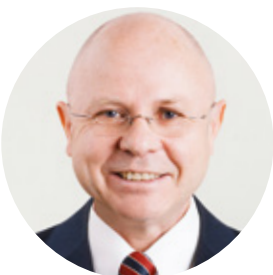
Johannes Michael Wareka Marzek Etiketten