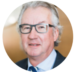
Eduard Fischer Offsetdruckerei Schwarzach