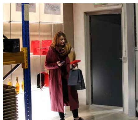
Track & Trace