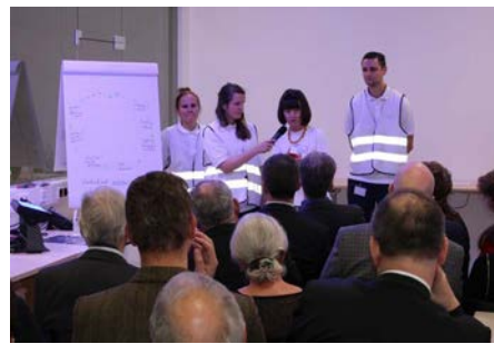
Testverfahren in der Qualitätssicherung

Bereits am Nachmittag konnten Kunden und ausgewählte Interessenten die Welt von SECURIKETT® besser kennen lernen und einen Blick hinter die Kulissen werfen. Nach dem Konzept eines Stationentheaters wurden fünf Gruppen, zwei englisch- und drei deutschsprachige, abwechselnd durch fünf Workshop-Stationen geführt. Spezialisten der Firma SECURIKETT® sowie Gastvortragende der Firma LEONHARD KURZ Stiftung & Co.KG gaben in interaktiven Präsentationen ihr Wissen weiter.