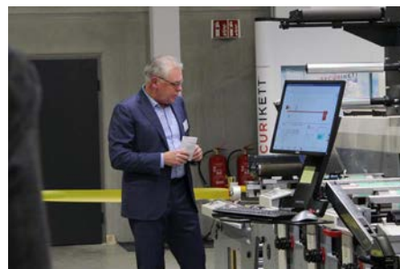
Entwicklung des Sicherheitsdruck

Das neue SECURIKETT® Gebäude entspricht modernen umwelttechnischen Standards, ist funktionell, und zeigt doch Persönlichkeit. Die neue Fabrik mit Produktion, Lager, Verwaltungstrakt und dem sogenannten „Casino“ (Aufenthaltsbereich und Küche) bieten den Mitarbeitern einen besseren Arbeitsplatz. Auch wurde bereits in neue Drucktechnologie investiert. SECURIKETT® wird mit diesem Investment seine Produktpalette besser und rationeller herstellen können, vor allem aber auch neue Lösungen für den Produktschutz entwickeln.