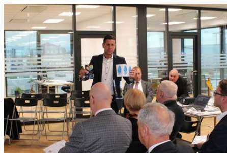
Hologramme als Sicherheitsmerkmal

Für die kommenden Jahre gibt es auch noch Platz für weitere Maschinen, mehr Kapazität und mehr Raum für Forschung und Entwicklung. Innovations- und Entwicklungsarbeit sind ein wichtiger Bestandteil von SECURIKETT®.